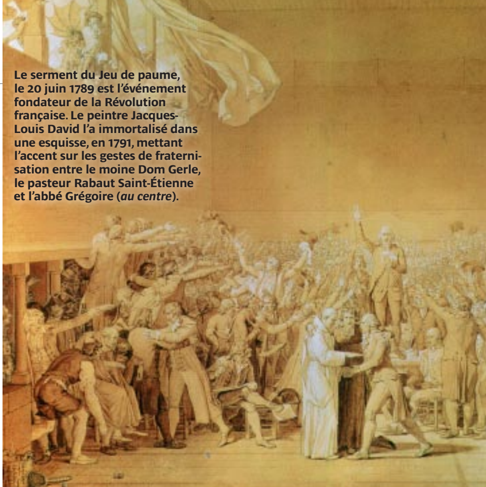
Le serment du Jeu de paume, le 20 juin 1789 est l'événement fondateur de la Révolution française. Le peintre Jacques-Louis David l'a immortalisé dans une esquisse, en 1791, mettant l'accent sur les gestes de fraternisation entre le moine Dom Gerle, le pasteur Rabaut Saint-Étienne et l'abbé Grégoire (au centre).