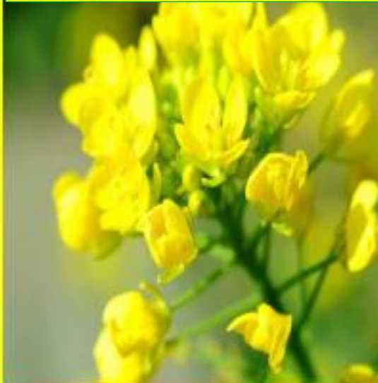
Graines de moutarde

Messe d'envoi en mission des catéchistes et accompagnateurs du catéchuménat 14 octobre 2023