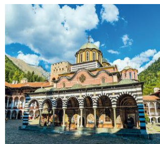
Monastère de Rila