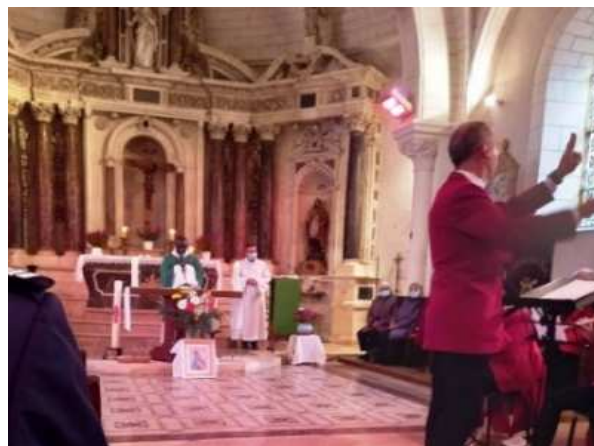
Le 14-11, Sainte Cécile fêtée en musique avec l'Herbaltoise et la présence des pompiers, à Herbault

Le 28 novembre la nouvelle année liturgique commence avec le 1 er dimanche de l'Avent . C'est l'occasion pour la paroisse de présenter ses vœux à toute la communauté de l'ensemble pastoral.