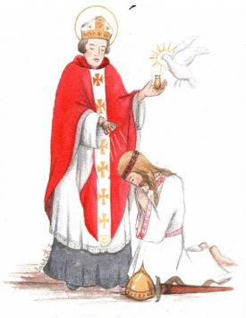
Saint Rémy baptisant Clovis

Issu d'une grande famille gallo-romaine de la région de Laon, il avait pour mère sainte Céline. A 22 ans, il est choisi comme évêque de Reims et son activité missionnaire s'étend jusqu'à la Belgique. Il fonde les diocèses de Thérouanne, Laon et Arras, crée tout un réseau d'assistance pour les pauvres et joue un rôle de médiateur auprès des Barbares. Quand le chef franc Clovis prend le pouvoir, saint Rémi lui envoie un message « Soulage tes concitoyens, secours les affligés, protège les veuves, nourris les orphelins. »