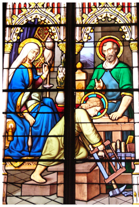
La Sainte Famille dans l'atelier de Saint Joseph, vitrail dans l'église Saint Denis à Mondoubleau

« Jésus a voulu naître et grandir dans une famille humaine ; il a eu pour mère la Vierge Marie et Joseph a été un père pour lui ; ils l'ont élevé et éduqué dans un immense amour. La famille de Jésus mérite véritablement le titre de « sainte », car elle est entièrement prise par le désir de remplir la volonté de Dieu, incarnée dans l'adorable présence de Jésus. D'une part, c'est une famille comme toutes les autres, et, en tant que telle, un modèle d'amour conjugal, de collaboration, de sacrifices, de confiance dans la divine Providence, de travail et de solidarité, en bref, de toutes les valeurs que la famille préserve et promeut, en contribuant de façon primordiale à former le tissu de chaque société. Mais dans le même temps, la Famille de Nazareth est unique, différente des autres, en vertu de sa vocation particulière liée à la mission du Fils de Dieu. Précisément en vertu de son unicité, elle indique à chaque famille, et en premier lieu aux familles chrétiennes, l'horizon de Dieu, la primauté douce et exigeante de sa volonté, la perspective du Ciel auquel nous sommes destinés. »