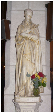
Saint Louis de Gonzague, statue dans l'église Saint Denis à Mondoubleau