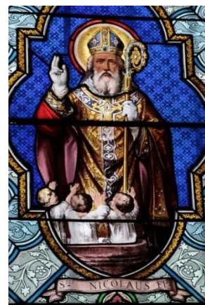
Saint Nicolas, vitrail dans l'église Saint-Nicolas à Droué

Saint Nicolas est né en Asie Mineure, au sein d'une riche famille chrétienne. Son histoire est jalonnée de nombreux actes saints et de miracles, accomplis dès le berceau. On raconte ainsi qu'il refuse le sein de sa mère les jours de jeûne. Un peu plus tard, devenu orphelin lors d'une épidémie de peste, il distribue tout son héritage aux pauvres. Devenu évêque de Myre, il assiste et souscrit au concile de Nicée en 325. Il est surtout célèbre pour sa grande générosité, sa charité et sa foi. Il sauve du naufrage l'équipage du bateau qui le mène en Terre sainte, en calmant la tempête. Il ressuscite même trois petits enfants qu'un boucher avait découpés et mis dans un saloir.