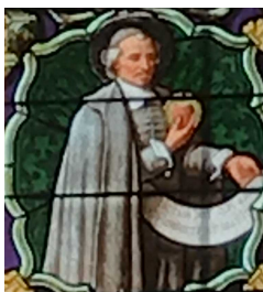
Saint Jean Eudes, vitrail dans l'église Saint-Denis à Mondoubleau

« Envoie, Seigneur, envoie des ouvriers à ta Vigne ; ressuscite, dans tous les pasteurs et prêtres de ton Église, cet esprit apostolique, dont tes bien-aimés Apôtres et Disciples ont été embrasés. Embrase leur cœur du feu de ton amour et d'une soif ardente de ta gloire et du salut des âmes ! »