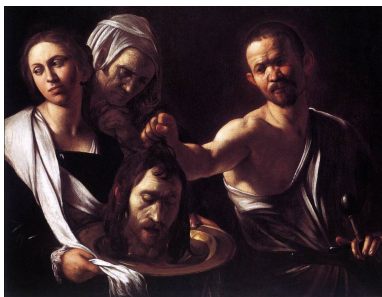
Le Caravage, Salomé avec la tête de saint Jean Baptiste (1607)

« En ce dernier mercredi du mois d'août, est célébrée la mémoire liturgique du martyr de saint Jean-Baptiste, le précurseur de Jésus. Dans le calendrier romain, il s'agit de l'unique saint dont on célèbre tant la naissance, le 24 juin, que la mort survenue par le martyr. (...)