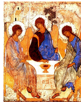
Andreï Roublev (1360 – 1430), Icône de la Trinité